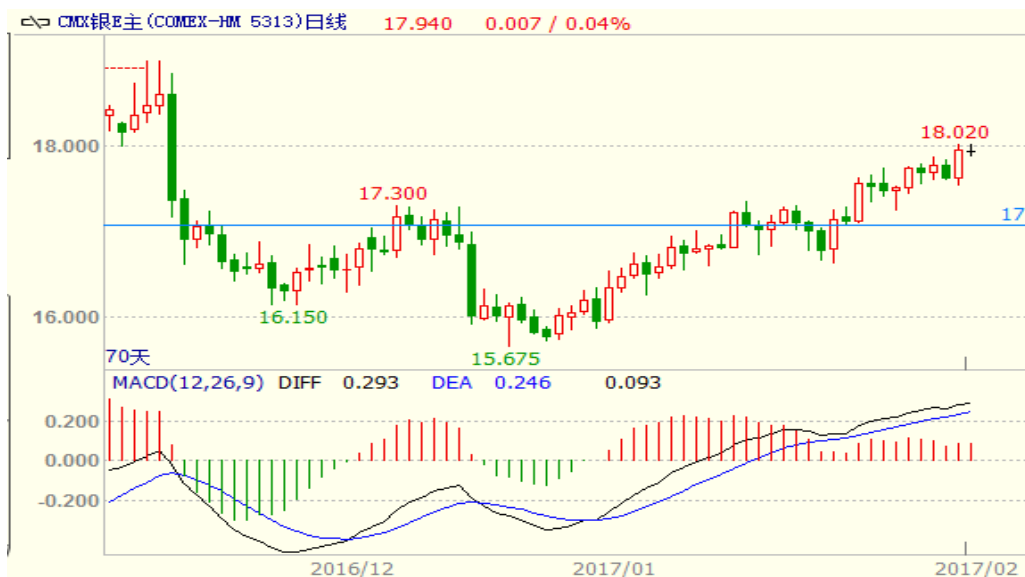
图 2：COMEX 白银主力合约技术分析