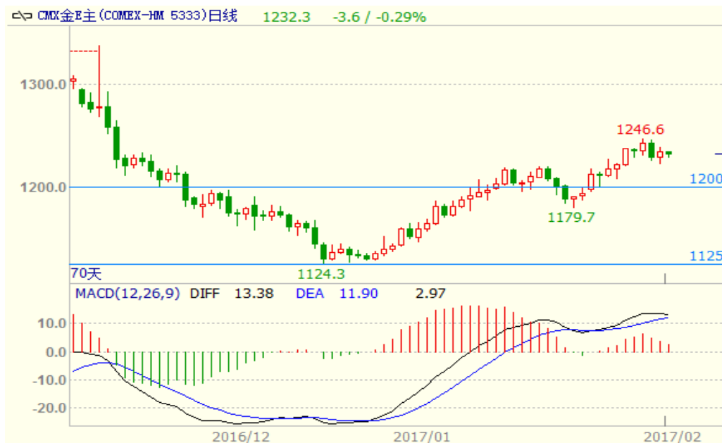
图 1：COMEX 黄金主力合约技术分析

COMEX 黄金上周先涨后跌，上方面临 1250 美元/盎司的压力位，预计本周黄金先跌后涨，因人民币对美元可能继续贬值，内盘金价涨幅或相对较大。